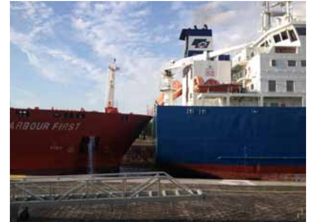
Maximale Kapazitätsauslastung einer Schleuse

hinderungen der Schifffahrt ablaufen, trotzdem muss den Kunden zu jeder Zeit deutlich gemacht werden, wo mit welchen Einschränkungen zu rechnen ist. Dafür bietet sich eine engere Zusammenarbeit in einem gemeinsamen Planungsstab zwischen Behörden, Bau-firmen, Lotsen, Kanalsteuern und Schiffsmaklern an. Es hat sich in der Vergangenheit gezeigt, dass Risikopotentiale von den verantwortlichen Nautikern in den Verkehrszentralen und den Fachleuten vor Ort sehr unterschiedlich beurteilt werden. Der drastische Personalabbau bei den Betriebsdiensten der Wasser- und Schifffahrtsverwaltung hat inzwischen dazu geführt, dass sicherheitsrelevante „Kleinreparaturen“ wie z.B. der Ersatz defekter Kanal-befeuerung oder die für das Manövrieren in den Weichen zwingend notwendige Dalbenbeleuchtung wochen - wenn nicht gar monatelang nicht durchgeführt werden. Für die Lotsen und