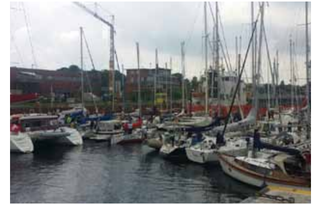
Berufs- und Sportschifffahrt gemeinsam in einer Schleuse

Weitaus dramatischer stellt sich die Situation in Kiel dar, obwohl der Zustand der großen Schleusenkammern dort im Allgemeinen besser als in Brunsbüttel ist 14 . Weil die kleinen Schleusen seit Juni 2014 außer Betrieb sind, müssen einerseits alle Kleinfahrzeuge (insbesondere Sportboote) mit durch die großen Kammern geschleust werden. Andererseits entfällt