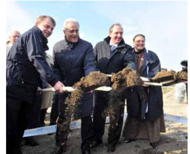
Feierlicher Spatenstich zum Bau der 5. Schleuse in Brunsbüttel, April 2012

Bei allen diesen Projekten sind - wie eingangs dargestellt - erhebliche Zeitverzögerungen erkennbar; Verzögerungen bei den Projekten unter 1. und 3. bedingen dabei zwangsläufig einen verspäteten Beginn der dringend erforderlichen Sanierungsarbeiten an den großen Schleusen in Brunsbüttel und Kiel-Holtenau. Vom Bundesverkehrsministerium wurden folgende