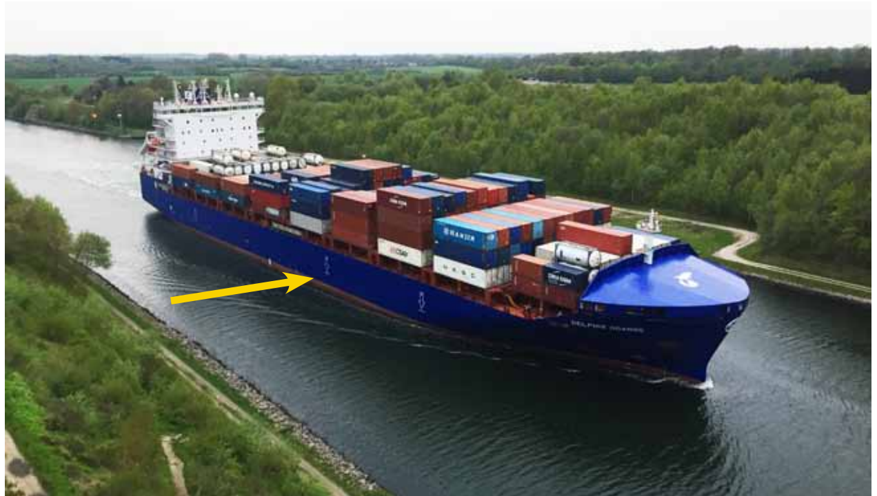
Delphis Gdansk“ mit maximal im NOK möglicher Abladung (Der Pfeil zeigt die Differenz zur Lademarke)“

Inzwischen wurde in diesem Fahrtgebiet aufgrund des weiter steigenden Bedarfs eine Nachfolgeneration mit einer deutlich erhöhten Kapazität von 1.926 TEU etabliert. Die Schiffe der sogenannten „Delphis“-Klasse wurden vom Reeder als „Kiel-Canal-Max“-Schiffe konzipiert und sollen unter optimaler Ausnutzung der erlaubten Abmessungen im NOK eingesetzt werden. Dabei wurde die erhöhte Tragfähigkeit besonders durch die deutlich vergrößerte Breite von 30,55 m (entspricht einer Reihe zusätzlicher Container über die Schiffslänge) erreicht. Das Erreichen der maximalen Auslastung dieser Schiffe wird aber aufgrund des Längen-/Breitenverhältnisses durch den maximal erlaubten Tiefgang von „nur“ 8,5 m wiederum eingeschränkt 22 , wobei der Betreiber davon ausgehen durfte, dass nach einer Umsetzung der Kurvenbegra-