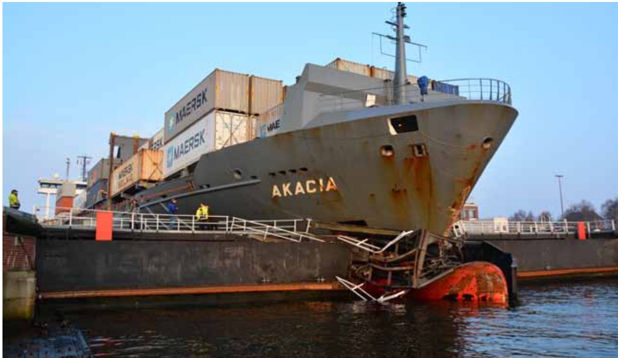
Maximale Schleusenbeschädigung im Februar 2018

Nach einer Woche war klar, dass die damit anstehende komplexe Aufgabe (Zerschneiden des Tores und Herausheben der Einzelteile) durch die eigenen Mittel der WSV unmöglich war. Deshalb wurde der Auftrag in der kompletten Abwicklung an eine externe Firma übergeben. Die Abwicklung im nahezu „Betrieb rund um die Uhr“ muss als perfekt bezeichnet werden; die lückenlosen Informationen (was wird wann und wie getan) für die Kunden und Beteiligten am NOK ließen keinerlei Zweifel an der Abwicklung aufkommen.