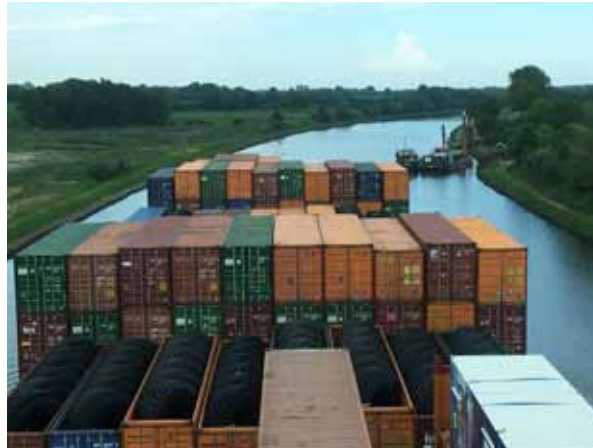
Passage eines Feederschiffes bei laufenden Böschungsarbeiten

Die Ausbaumaßnahmen im Bereich Königsförde bis Kiel-Holtenau sowie die geplante Vertiefung des gesamten Kanals werden zwar zum größten Teil ohne Be-