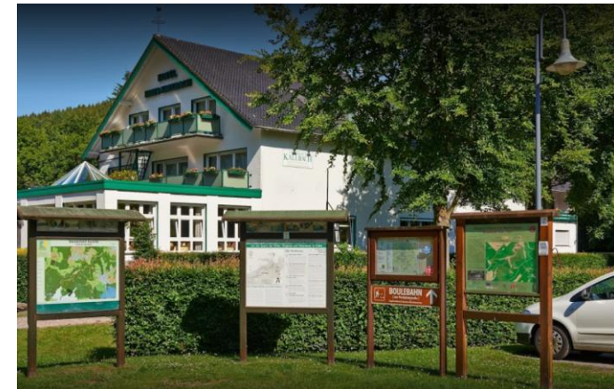
Bild: Hotel Kallbach, rechts daneben öffentlicher Parkplatz

Parkmöglichkeiten auf dem öffentlichen Parkplatz sind ausreichend vorhanden.