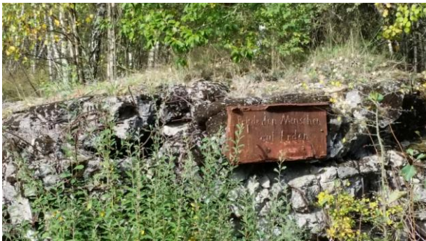
Bild: Mahnmal Todtenbruch Raffelsbrand

Besichtigung, technische Informationen und Mitfahrgelegenheiten