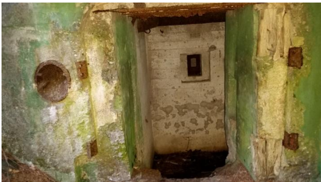
Bild: Innenansicht Westwall Bunker bei Hürtgen

Die Veranstaltung findet jährlich am ersten Sonntag im Mai und im September statt.